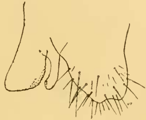
Prenolepis amblyops For. Armatura genitale maschile.

Il ♂ non era ancora conosciuto. Giallo testaceo, gastro bruniccio; irto di setole brune, sottili e acuminate. Capo ritondato, con l'orlo posteriore più largamente arcuato, angoli posteriori ritondati. Il diametro longitudinale dell'occhio è un po' maggiore della distanza che separerebbe il suo estremo posteriore dall'angolo del capo, supposto acuminato. Lo scapo oltrepassa l'occipite di metà circa della sua lunghezza. La struttura dei genitali ricorda P. Humbloti For. (secondo la figura di Forel) e forse ancora più P. Sikorae For. Lo stipite è massiccio, incavato all'apice, la lacinia è più breve della volsella, con due ordini di tubercoli alla estremità, la volsella è larga, obliquamente troncata e fornita di quattro ordini di tubercoli. L. 2 — 2 1/5 mm. È molto più grande del ♂ di P. Sikorae , più piccolo e più chiaro di quello della P. Humbloti .